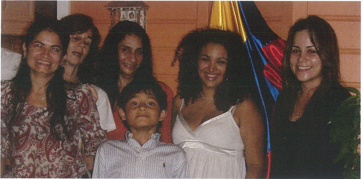
Las colonias en Niza, Martinica y Guadalupe: Una composición prioritariamente femenina.