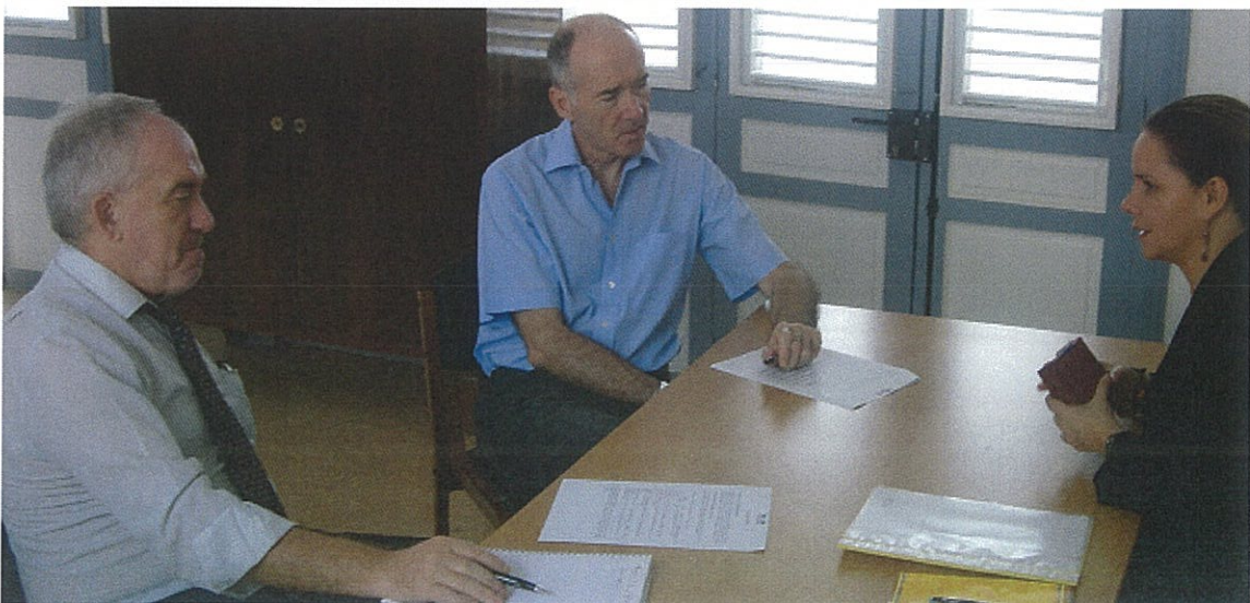
Un contacto fluido con las autoridades locales en beneficio de la población colombiana