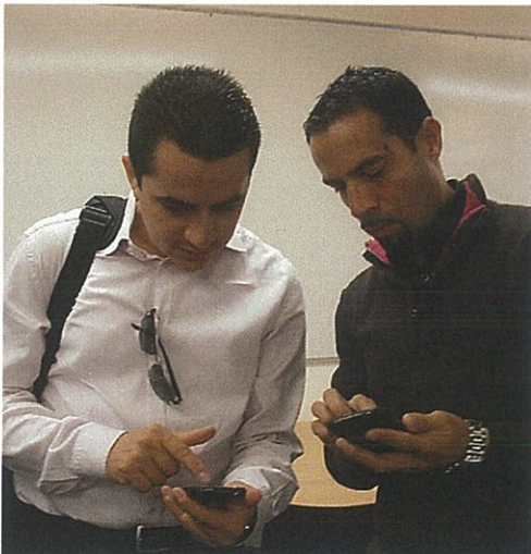
Un espacio de encuentro entre connacionales que permite reforzar la cohesión, la solidaridad y el empresariado.