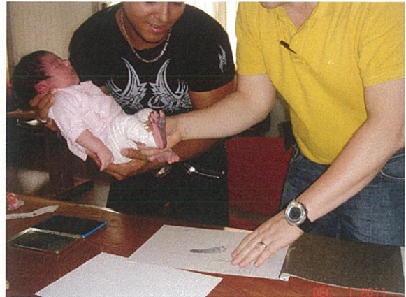
Nuevos colombianos: el orgullo de sus padres

Estos Consulados Móviles permitieron también formular de manera conjunta, con miembros de las comunidades colombianas, iniciativas y proyectos para el 2012 asegurando su pertinencia. Por ello, el Cónsul General de Colombia en Francia, Luis Fernando Jaramillo, agradeció a las Asociaciones de colombianos y a los líderes comunitarios que contribuyeron al éxito de este recorrido así como a las autoridades locales por su acogida.